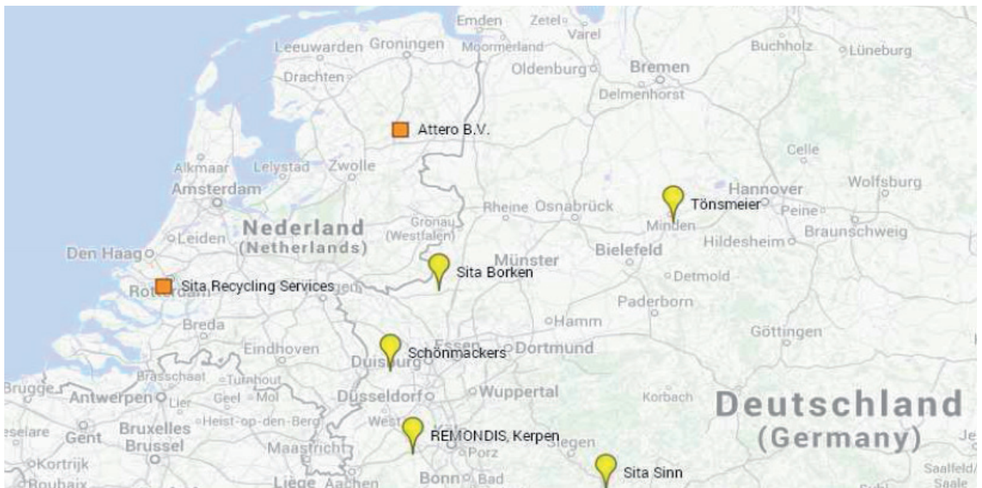
Figuur 1. Bestaande grote sorteerbeidrijven in Duitsland en Nederland

Onderstaande kaart geeft een overzicht van de huidige grote sorteerders in Duitsland en Nederland.