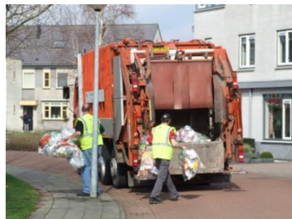
het inzamelen in de wijk