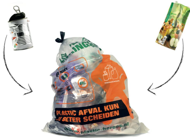
Afbeelding op voorkant van afvalwijzer van Oldenzaal

De afvalwijzer van gemeente Oldenzaal blinkt uit in heldere communicatie in woord en beeld. Zo wordt de afvalstroom drankenkartons, blik en plastic in de afvalwijzer 'verpakkingen' genoemd. Op de voorkant van de afvalwijzer geeft één beeld gelijk de gewenste handeling aan (blik en drankkarton staan met een pijltje gericht op de zak waar ze in moeten).