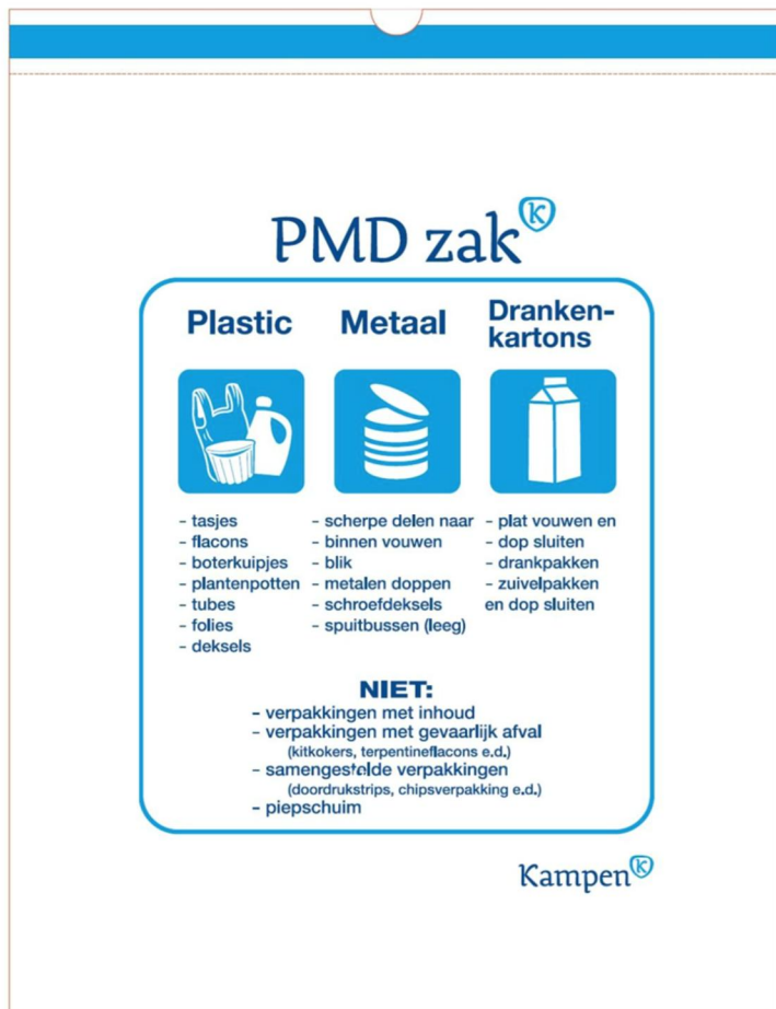
Vuilniszak met afvalinformatie van Kampen