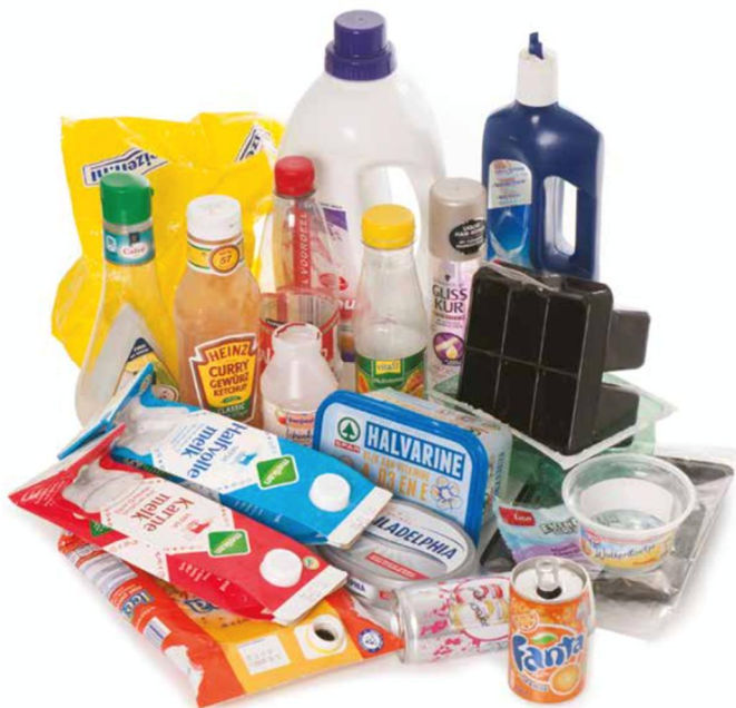
Illustratie uit afvalwijzer van Rova

Tip: Let op hoe kleuren worden toegepast. Een rode kleur om te duiden iets positief te duiden werkt contraproductief. Gebruik voor de Wel-lijst daarom de kleur groen en voor de Niet-lijst de kleur rood