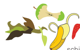
schillen en resten van groenten en fruit

Gfe staat voor groenten-, fruit- en etensresten. In het biobakje mag alles wat eetbaar is: