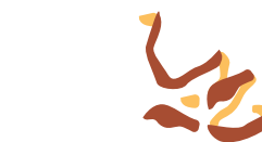
schillen van aardappelen