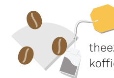
theezakjes, koffiepads, koffiefilters met koffiedik