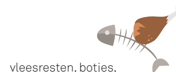
vleesresten, botjes, visresten en graten