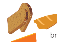
brood- en kaaskorsten