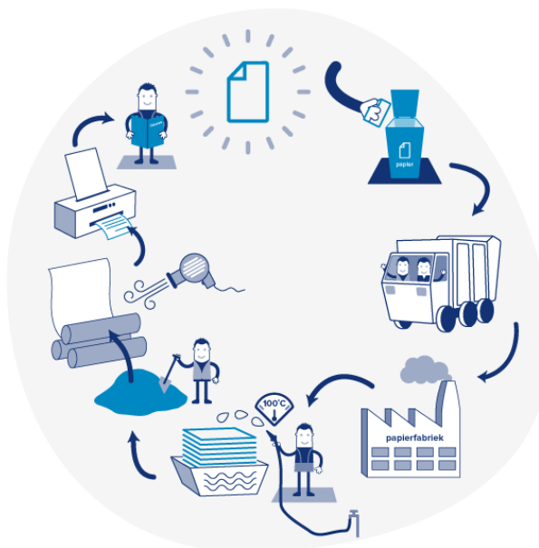
Figuur 9.