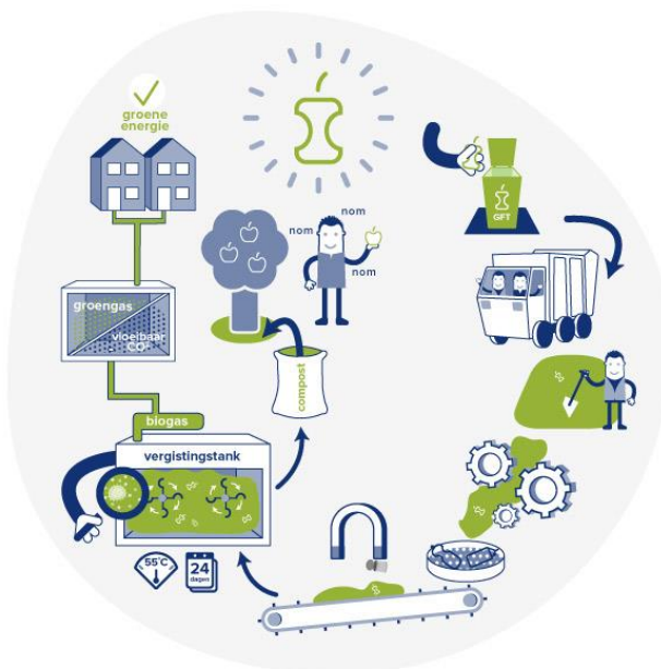
Figuur 6.

Laat zien wat er met GFT/GFE gebeurt. Maak hier de koppeling van GFT/GFE naar compost en naar de twee moestuinen in de wijk. Wellicht kan deels gebruik worden gemaakt van beeldmateriaal van Avalex (zie figuur 6)