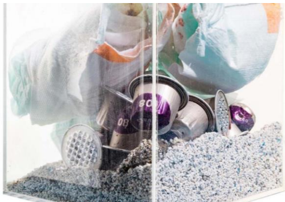
Figuur 11.

Geef visueel aan wat er bij rest hoort. Denk bijvoorbeeld aan kattenbakkorrels, chips zakken, pizzadozen, pakken babyvoeding, etc. (selecteer op veelvoorkomend afval). Gebruik hier een zelfde kader/ lay-out als bij PMD, GFT en Papier en koppel het weer aan de icoontjes van Avalex.