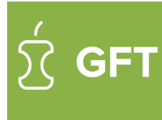
Figuur 4. Icoon GFT van Avalex