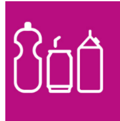
Figuur 1. De icoontjes die Avalex gebruikt voor PMD