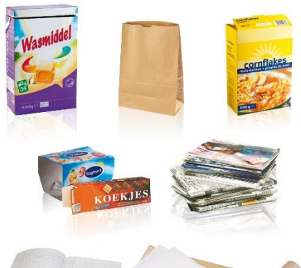
Figuur 7. Bron: https://www.fostplus.be/nl/sorteren-recycleren/alles-over-sorteren/papier-karton-sorteren/correct-papier-karton-sorteren

VISUEEL: Geef visueel aan wat bij papier en karton hoort, zoals in figuur 7. Laat bijvoorbeeld ook een eierdoos zien. Gebruik hier een zelfde kader/ lay-out als bij PMD en GFT en koppel het weer aan de icoontjes van Avalex.