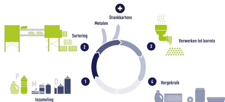
Figuur 3.

Laat met een visual zien hoe PMD hergebruikt wordt (zie figuur 3).