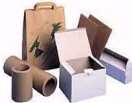
Figuur 3 Enkele producten gemaakt uit papier gerecycled uit drankenkartons dat vervangen wordt door energetisch gebruik van PE

De methodes hieronder beschrijven verschillen vooral in het soort brandstof.